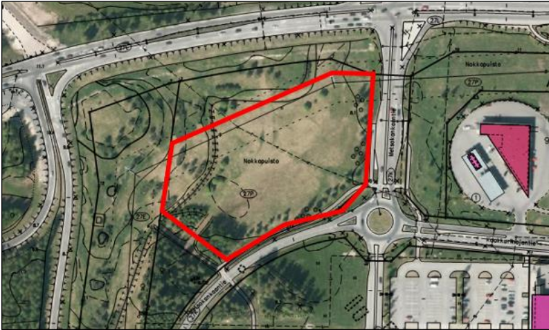
Kuva 2. Kuvassa kantakartan kanssa ote ilmakuvasista, johon piirretty suunnittelualueen alustava rajaus.

Suunnittelualue sijaitsee Kaakkurin kaupunginosassa Kaakkurin aluekeskuksen luoteisosassa nykyisessä Nokkapuistossa. Suunnittelualue rajautuu idässä ja etelässä Metsokankaantiehen, lännessä asemakaavan suojaviheralueeseen (EV) ja pohjoisessa Oulunlahdentien varren puistoalueeseen, jossa rajaus myötäilee puiston läpi kulkevaa 110 kV:n voimalinjaa. Suunnittelualue on rakentamaton avoin puistoalue, jonka reuna-alueilla kasvaa koivuja ja kuusia. Suunnittelu-alueen pinta-ala on noin 1,5 ha. Alue on Oulun kaupungin omistuksessa.