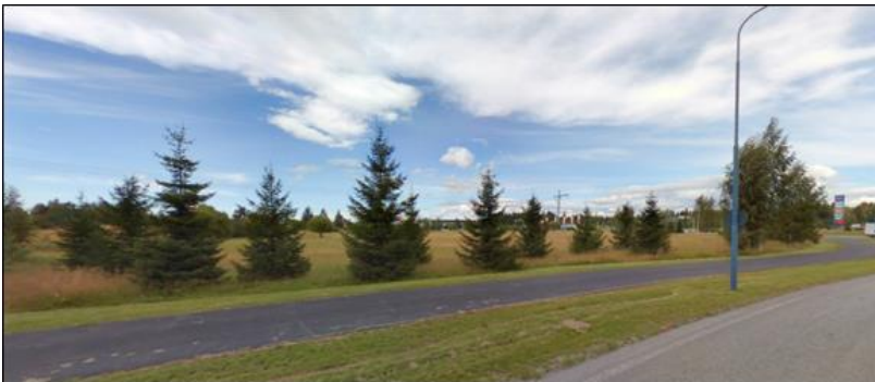
Kuva 3. Näkymä suunnittelualueelle Metsokankaantieltä pohjoiseen.